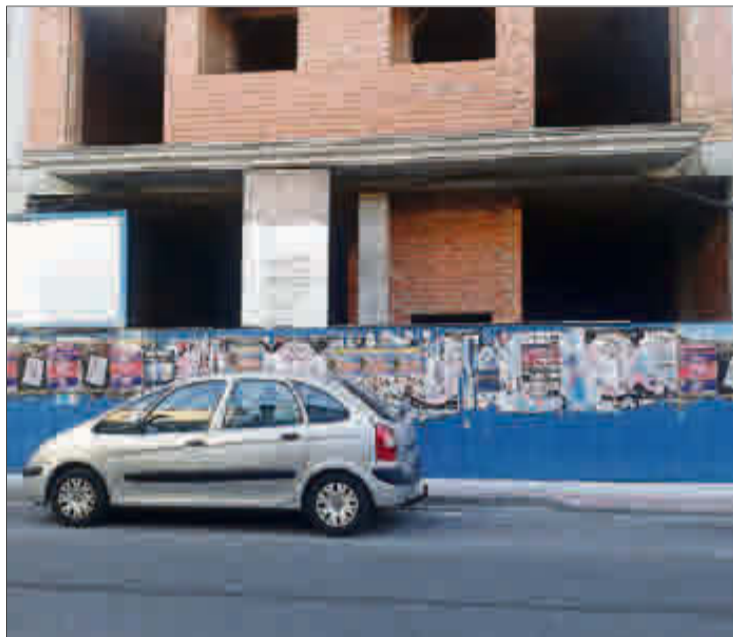
Fachada sin terminar en el municipio de Silleda.

En el caso de que el propietario de una construcción sin acabar no atienda el requerimiento del concello para finalizar la obra, el ayuntamiento procederá a su ejecución forzosa con la imposición de los